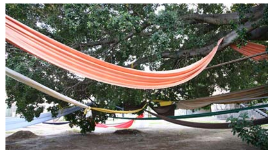
CASTELLO DELLA CUBA

Introduction par le commissaire de l'exposition Achille Bonito Oliva le jour de l'inauguration :